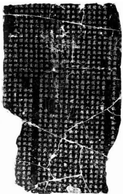
龙藏寺碑拓片,藏于国家图书馆

闲来无事,我忽想到一位多年未谋面的友人,就即兴去走访。登门后友人径直把我引入书房。一进门的我双目条件反射般地横扫起友人的藏书来,很快,一本红色书皮印着《嵊州抗日史》的书被我的目光锁定。于是,我拿来书本翻开,首先浏览起目录,当看到“嵊州儿女的抗日斗争·市内篇”章节时,意外惊喜地发现一篇由现代著名作家骆宾基撰写的《我在嵊县抗日救亡活动片断》的文稿。哦,大作家曾来过咱们的嵊县,还给嵊县留下了“墨宝”,顿时更加激发了我浓厚的阅读感。